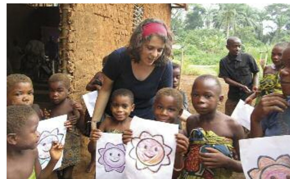
1. PROYECTO DE EVANGELIZACION INTEGRAL DEL PUEBLO PIGMEO.BAYENGA. REPUBLICA DEMOCRATICA DEL CONGO.

Me siento respetada, querida y acogida como mujer y como laica, mucha naturalidad en todo y eso me hace bien, mucho bien.